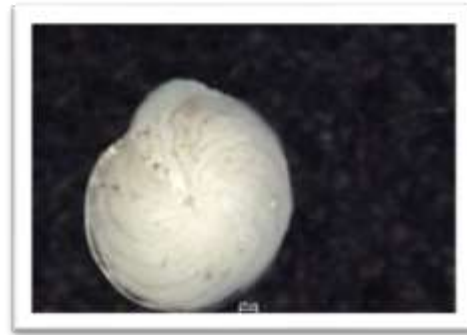
Gambar 1. Amphistegina lessonii , foraminifera yang banyak ditemukan di lokasi penelitian

melimpah di setiap stasiun pengamatan, ini dikarenakan kondisi terumbu karang di lokasi pengambilan dalam kondisi baik.