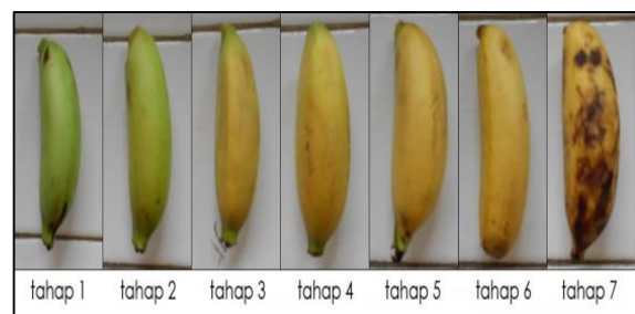
Gambar 3. Tahap pematangan buah pisang Muli

Warna kulit buah pada setiap tahap pematangan buah pisang Muli ditunjukkan pada Gambar 3.