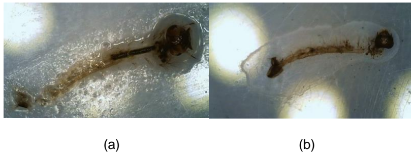
Gambar 3. Kerusakan morfologi larva instar III Aedes aegypti pada konsentrasi (a) 500 ppm dan (b) 1.000 ppm.

Kerusakan morfologi larva instar III pada perlakuan konsentrasi 500 dan 1.000 ppm dapat dilihat pada Gambar 3a dan 3b. Sedangkan kontrol negatif tidak mengalami kerusakan dan morfologi yang masih lengkap (Gambar 4).