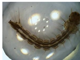
Gambar 4. Morfologi larva instar III pada kontrol negatif.