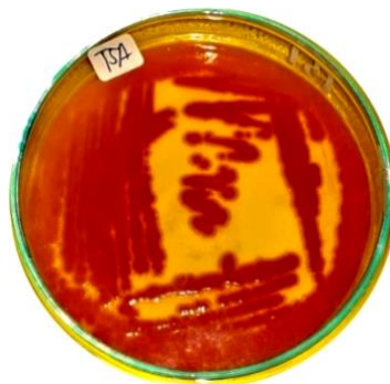
Gambar 1. Hasil subkultur S. marcescens pada media TSA.