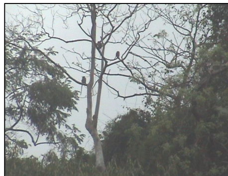
Gambar 2. Monyet ekor panjang tidur di pohon ki hujan.

menyukai pohon ini sebagai tempat tidurnya yang dibuktikan dengan tingginya frekuensi pemakaian pohon ki hujan sebagai pohon tidur.